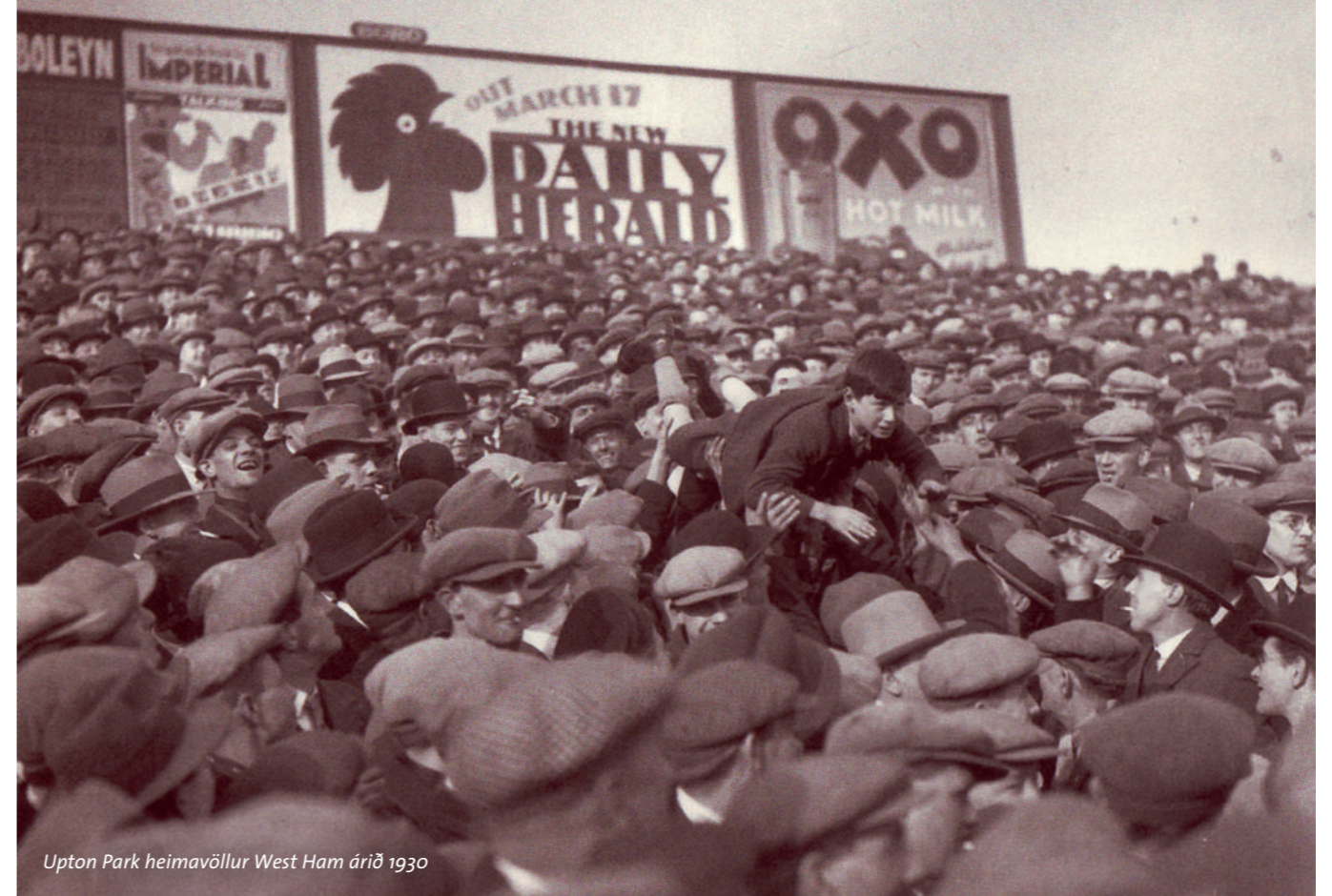
Upton Park heimavöllur West Ham árið 1930

Á aðeins 30 árum hafði knattspyrna vaxið úr því að vera tómsundaiðja örfárra sérvitra, enskra skólamanna í að verða vinsælasta íþrótt breskrar alþýðu og viðurkennd atvinnugrein. Æ fleiri leikmenn komu úr verkamannastétt og höfðu hvorki efni né áhuga á að spila sem áhugamenn í frístundum með tilheyrandi kostnaði og tekjuskerðingu. Og þar sem sífellt fleiri áhorfendur reyndust reiðubúnir að borga sig inn á völlinn til að berja þá augum sáu þeir heldur enga ástæðu til þess.